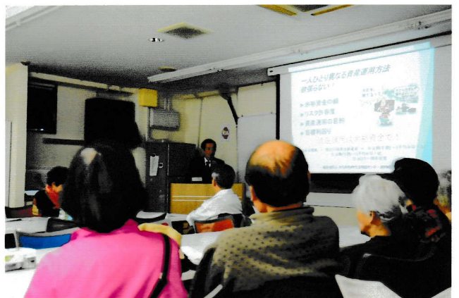
今回の講話は多くの人に聴いて欲しかった、全員拍手