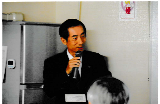
植田講師時にはユーモアを交え、自分で判断しないようにと