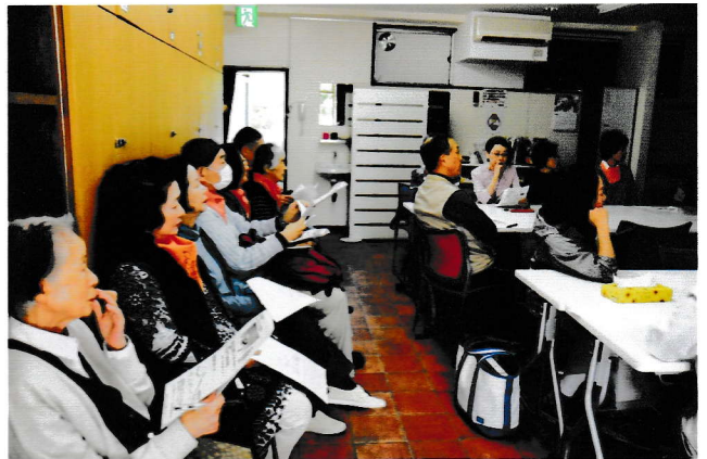
健康と同じ大事な話だけにお客様熱心に聴く